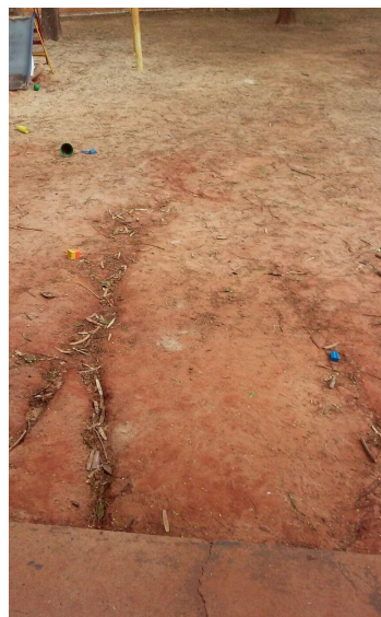
pateo sem acabamento